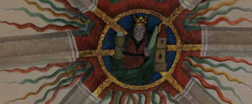
Barbara – Namensgeberin der Kirche im Chorraum