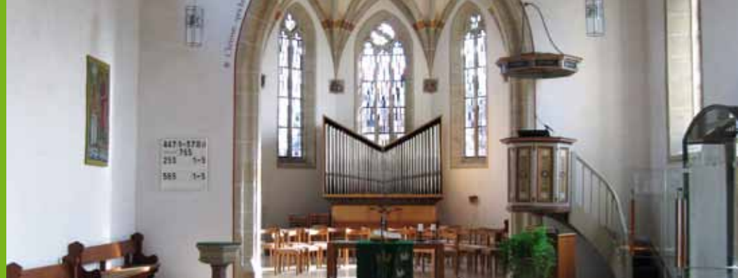
Kirchenschiff mit Stehle-Organ