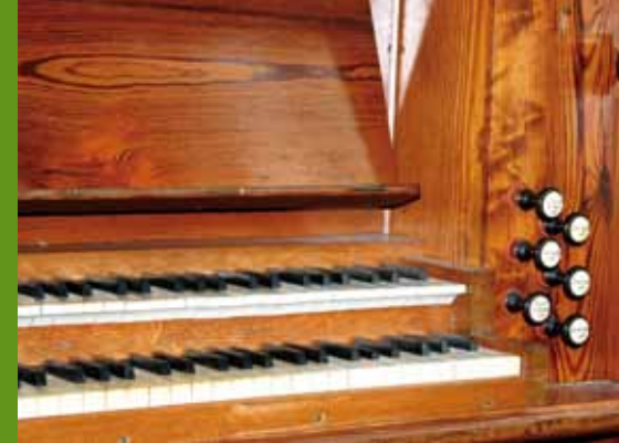
Manuale der Sweetland-Orgel

Christus spricht: Kommt her zu mir, alle, die ihr mühselig und beladen seid; ich will euch erquicken.