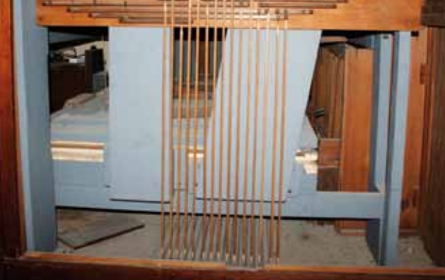
Innenraum der Orgel