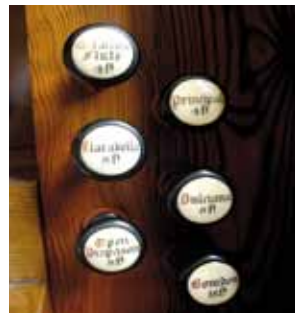
Manuale und Register der Stehle-Organ