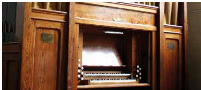
Front der Sweetland-Orgel mit Pfeifen